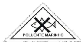
RÓTULO DE RISCO ADICIONAL**