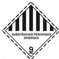
RÓTULO DE RISCO PRINCIPAL