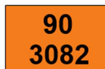
PAINEL DE SEGURANÇA

LEMBRETE: No caso de transportar este produto com outros produtos diferentes, consultar a Resolução 5.947/21 e ABNT NBR 7500 para realizar a sinalização correta conforme as particularidades.