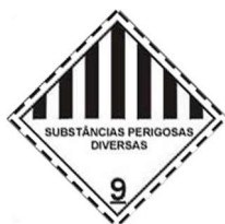
RÓTULO DE RISCO PRINCIPAL