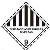
RÓTULO DE RISCO PRINCIPAL